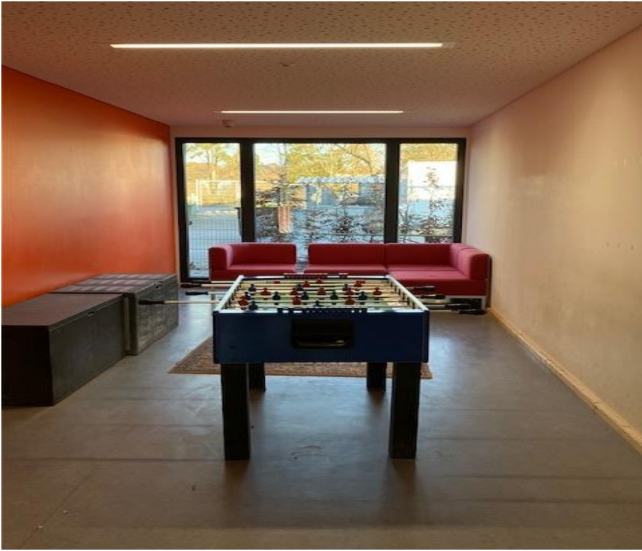
Eingangsbereich mit Tischkicker