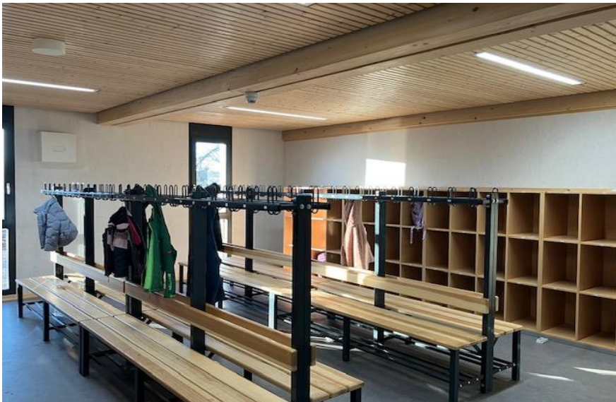
Garderobe mit Ranzenfächern