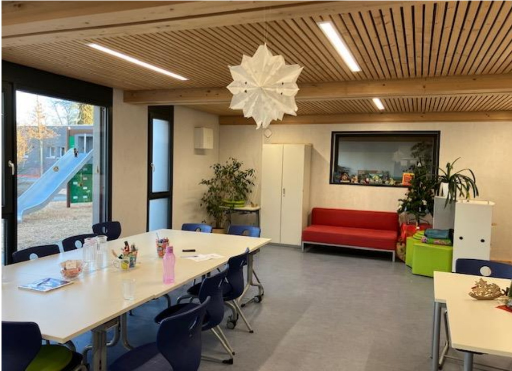
Betreuungsraum zur ruhigen Beschäftigung